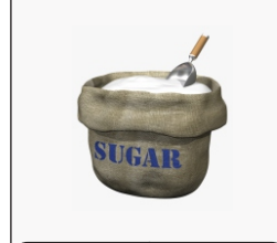
Sugar El azúcar