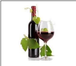
Wine El vino