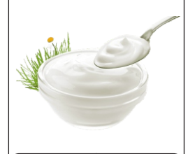
Yoghurt El yogurt