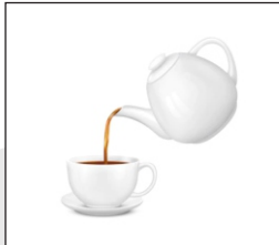
Tea El té