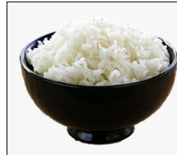
Rice El arroz