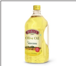
Olive oil El aceite de oliva