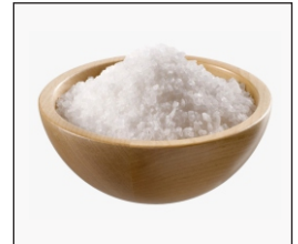
Salt La sal