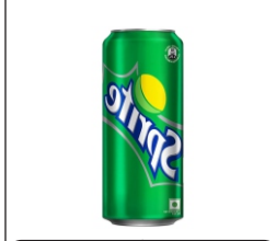
Soft drink El refresco