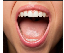
Mouth La boca