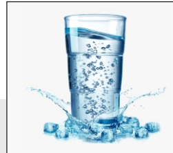
Water El agua