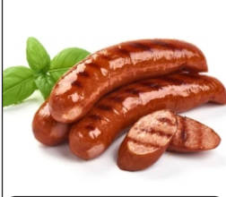
Sausage El chorizo