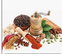
Spice La especia