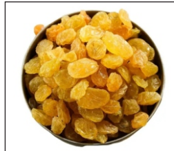
Raisin La uvaspasa