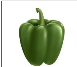
Pepper La pimienta