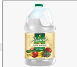
Vinegar El vinagre