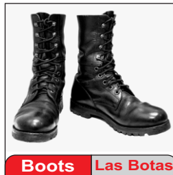
Boots Las Botas