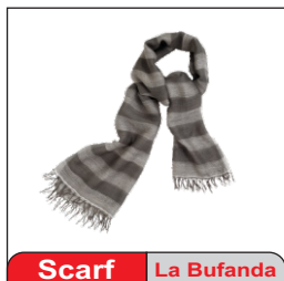
Scarf La Bufanda