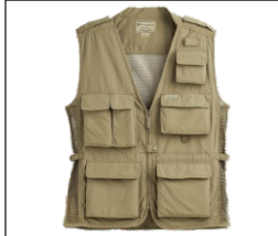
Vest El Chaleco