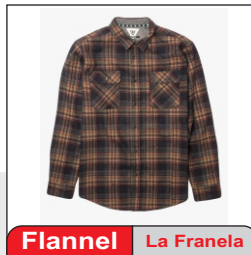
Flannel La Fanela