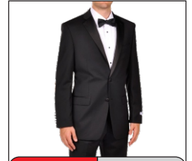
Tuxedo El Esmoquin