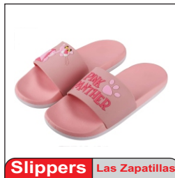
Slippers Las Zapatillas