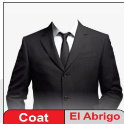
Coat El Abrigo