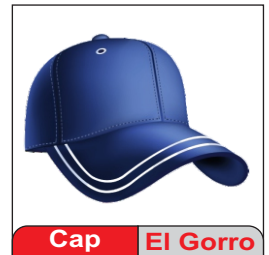
Cap El Gorro