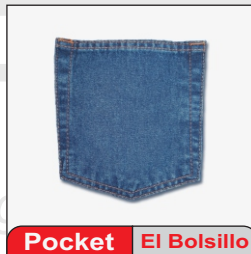
Pocket El Bolsillo