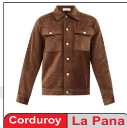
Corduroy La Pana