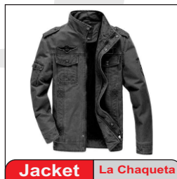
Jacket La Chaqueta