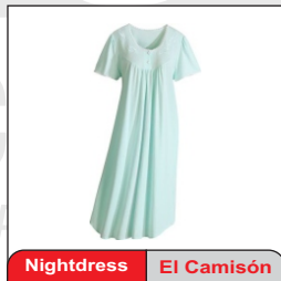
Nightdress El Camisón