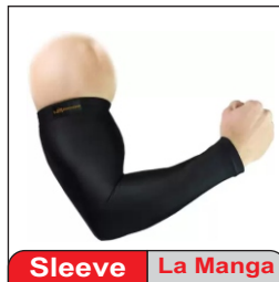
Sleeve La Manga