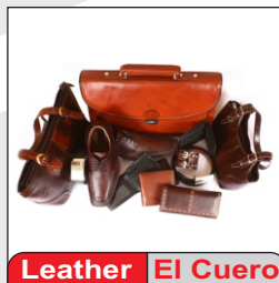
Leather El Cuero