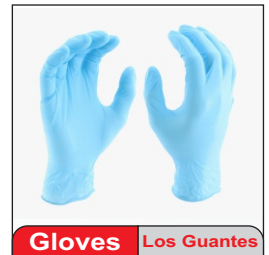
Gloves Los Guantes