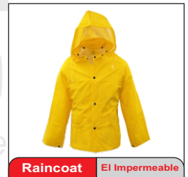
Raincoat El Impermeable