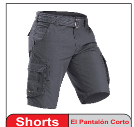
Shorts El Pantalón Corto