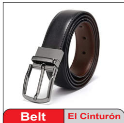
Belt El Cinturón