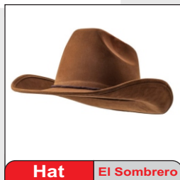
Hat El Sombrero