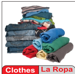
Clothes La Ropa