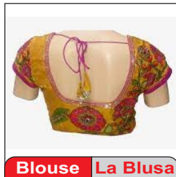
Blouse La Blusa