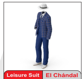
Leisure Suit El Chándal