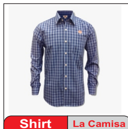
Shirt La Camisa