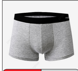
Underwear La Ropa Interior