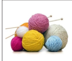
Wool La Lana