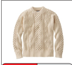
Sweater El Suéter