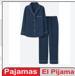
Pajamas El Pijama