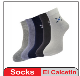
Socks El Calcetín