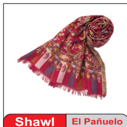
Shawl El Pañuelo