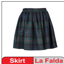
Skirt La Falda