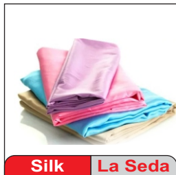
Silk La Seda