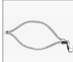
Zipper La Cremallera