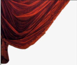
Velvet El Terciopelo