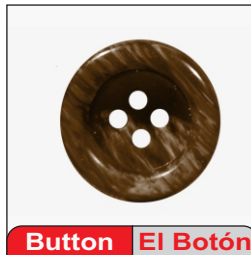
Button El Botón