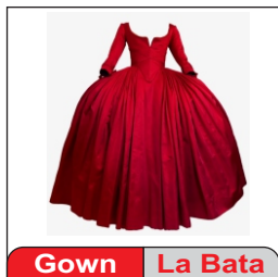
Gown La Bata