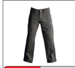
Trousers El Pantalón