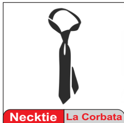
Necktie La Corbata